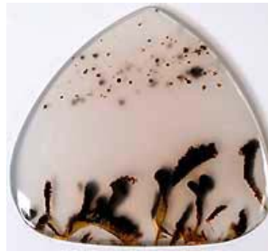
Montana-Achat- Cabachon, USA